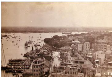
沙面岛和广州外滩

“这些官员将会获得一定的社会地位和影响力，这是他们从一般个人经历中难以获得的，他们也有义务为国人提供优质服务。”