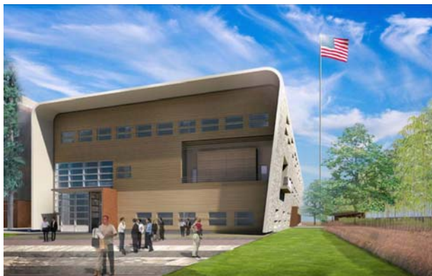
美国驻广州领事馆未来的办公点

今天的广州已与过去大不相同。在这个既古老又年轻的城市里，一方面古塔，名胜保存良好，另一方面现代化高楼大厦，高速公路不断建起，使这里成为一个经济中心也是一个政治中心。今天美国在广州所进行的外交活动已与过去大不相同，但美国驻广州领事馆仍将继续为美国公民，美国企业提供高效优质的服务，同时也为推进美国外交不懈努力。如果说世界通过广州来了解中国这个人口大国，那美国驻广州总领事馆也将继续起着桥梁的作用，促进美国与中国华南地区相互了解。