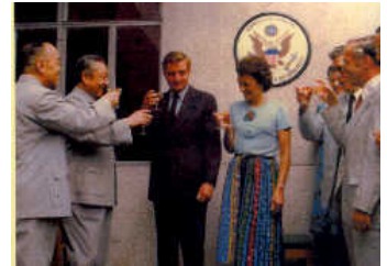
前副总统曼德拉庆祝美国驻广州领事馆重新开馆

自1980年起，珠三角地区（环珠江地区包括深圳和珠海）的国民生产总值以每年16%的速度增长。当时，在这片只有三千五百万人口的地方，出口额占中国总出口量的三分之一。今天，根据美国领事馆的政治经济部官员报告，该领区（广东，广西，福建，海南）已有两亿中国人和六千美国人。由于华南地区尤其是珠三角地区经济高速发展，美国更重视该地区的经济发展情况。1985年美国商务部和农业部分别在广州设立了商务处和农贸处，办公地点在流花路的中国大酒店。为了更好地推进美国外交政策，美国在广州花园酒店设立了新闻文化处，这个办公室在中美文化交流方面起着重要的作用。新闻文化处负责发布新闻，提供参考资料，宣传美国政策，组织记者招待会等媒体活动，以及向当地媒体提供及时有用的信息。除此之外，美国国务院经过多年的筹备并投资十五亿美元，计划在2011建成一个新的领事馆，进一步提高服务质量。