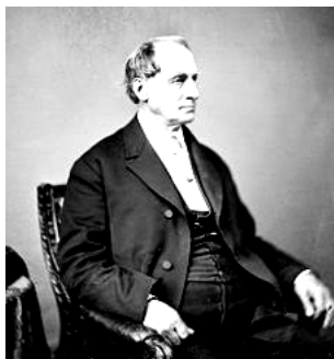
Caleb Cushing 美国驻中国第一位特命全权大使

“这些官员将会获得一定的社会地位和影响力，这是他们从一般个人经历中难以获得的，他们也有义务为国人提供优质服务。”