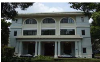
美国驻广州领事馆旧址 建于1893年